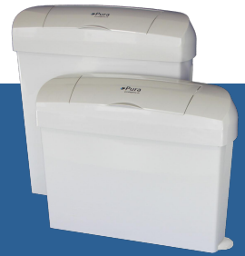
Art.-Nr. 823001 (23 Liter) F3201 (15 Liter) MIT FUSSPEDAL