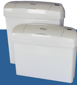
Art.-Nr. F3100 (23 Liter) F3300 (15 Liter) MIT SENSOR